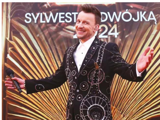
Projektant marynarki: Adrian Lewandowski